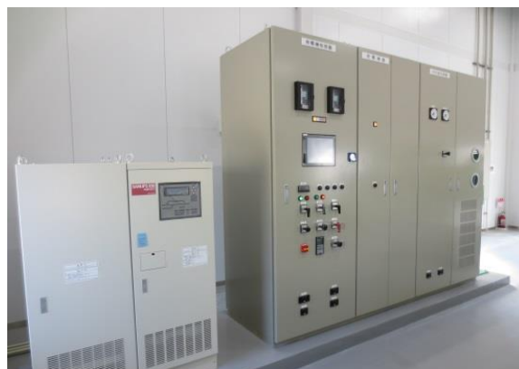
▲水車発電機制御盤