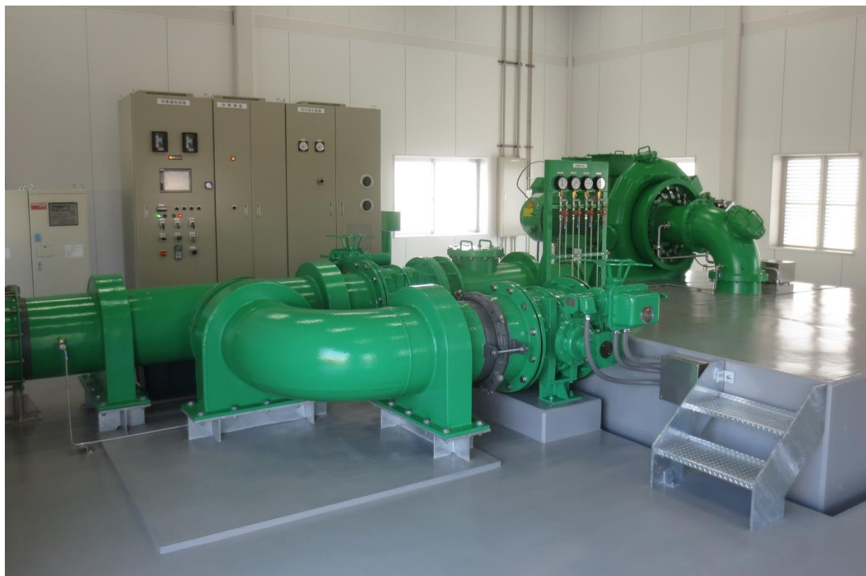
▲日野川用水第2発電所内部（越前市向新保町）

発行者 日野川用水土地改良区 (水土里ネット日野川用水) 第23号 令和元年5月