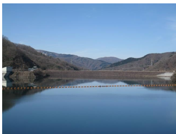
▲ 榎谷ダムの様子（満水位）

組合員の皆様には、それぞれの地区において計画的な用水配分や圃場毎のブロックローテーション等による用水管理を強化し、日野川用水の節水に努めていただきたいと思います。なお、用水管理や用水配分及び地元説明等について、ご相談・ご意見・ご要望がありましたら、お気軽に管理課までお問い合わせ下さい。