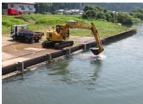
▲ 八乙女頭首工取水口土砂撤去

平成30年度は、用水供給に支障を与えるような、特に大きな災害等はありませんでしたが、安定した用水供給のために適切な施設の維持管理を実施しました。