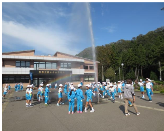
▲自然圧の噴水体験

平成30年10月18日（木）に、日野川用水の機能や「水」の大切さ、土地改良区の果たしている役割について理解を深めてもらうため、日野川用水食農体験学習塾「水と緑のふれあいフェスタ'18」を開催しました。学習塾には、鯖江市東小学校の4年生64名が参加し、榑谷ダムや八乙女頭首工、上水道処理施設の日野川地区水道管理事務所を見学しました。午後からは、水管理システムとパイプラインによる自然圧の噴水を見学し、お米を使った「ポン菓子」作りを体験しました。