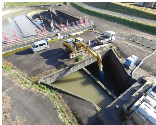
▲除塵機前土砂撤去状況