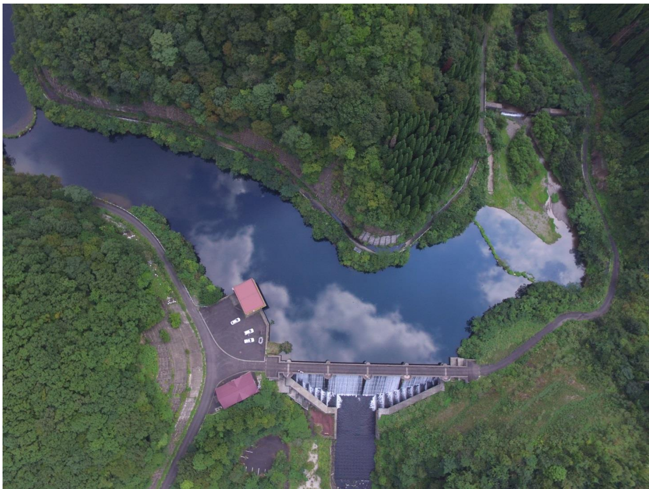
▲ニツ屋頭首工全景 (空撮)

発行者 日野川用水土地改良区 (水土里ネット日野川用水) 第25号 令和3年5月