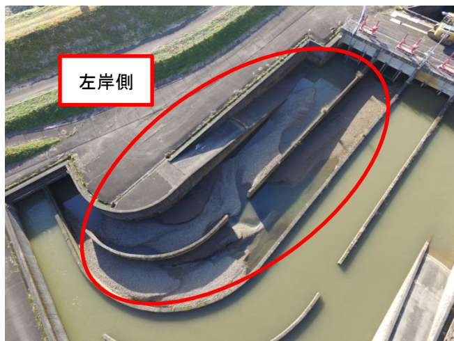
▲沈砂池土砂堆積状況

八乙女頭首工の沈砂池は日野川の右岸側に位置し、日野川用水の流速を低下させ泥や砂、ゴミ等を沈下させています。令和2年度は沈砂池と除塵機前の左岸側土砂を撤去することにより沈砂池としての機能を回復させました。