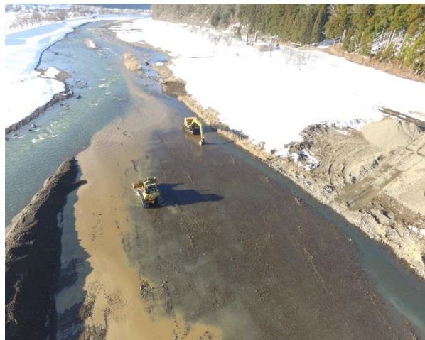
▲堆積土砂撤去工事中