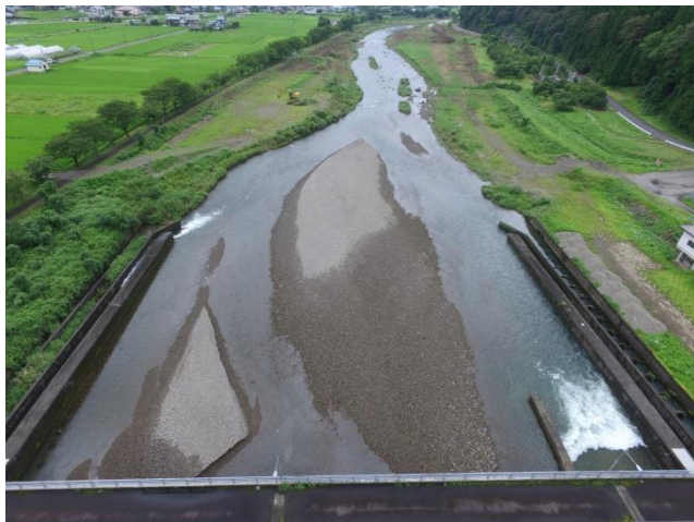
▲下流堆積土砂撤去前

取水施設である八乙女頭首工の下流部に大量の土砂が堆積し、ゲート開閉及び用水取水への悪影響を防止するため、令和2年12月にゲート下流部の土砂撤去工事を行いました。約2,000m 3 の土砂撤去を行った結果、安全かつ適切な頭首工管理が行えるようになりました。