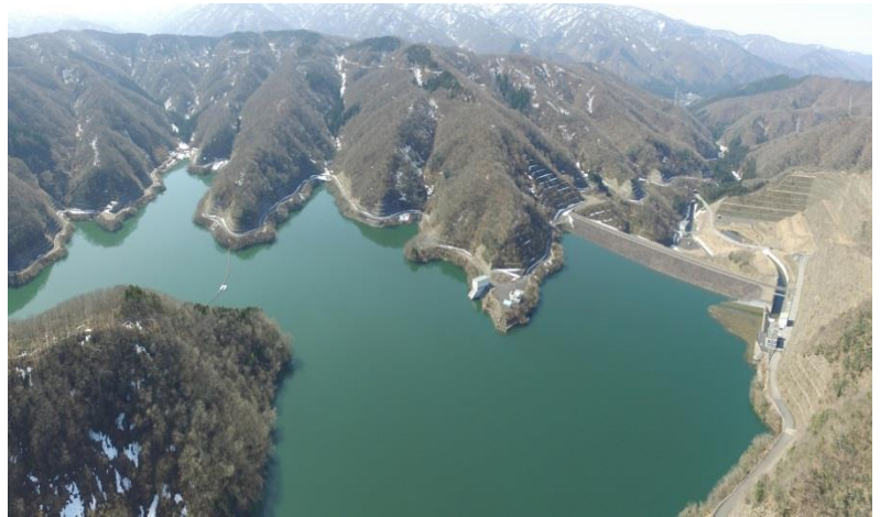
▲榎谷ダム（湖面から堤体方向）

なお、用水管理や用水配分及び施設の不具合等について、ご相談やご意見、ご要望がありましたら、お気軽に管理課までお問い合わせ下さい。